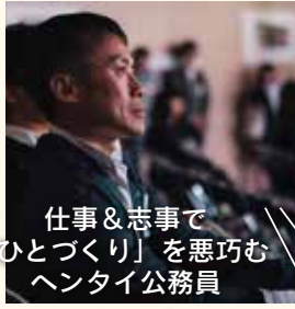
仕事&志事で 「ひとつづくり」を悪巧む ヘンタイ公務員

今年のテーマは『繋ぐ人たち』 ひとつづくり、イベント、ものづくり…。領域を超えて、それぞれが挑む“スピリット”に学ぶ。