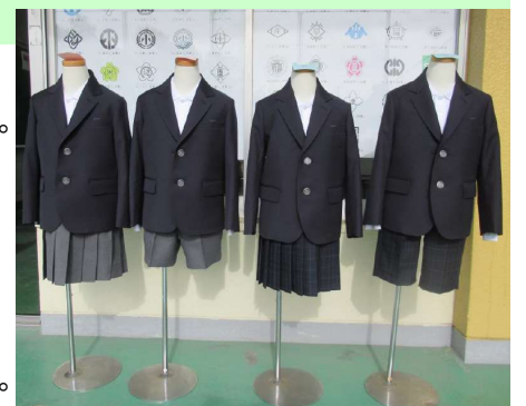
制服見本の展示の様子 (下津井東小学校)