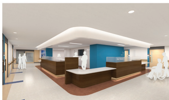
スタッフステーション