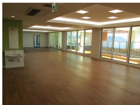
リハビリテーション室