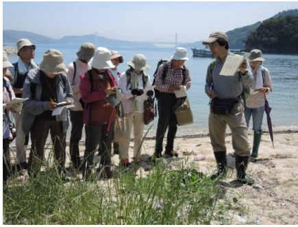
[5月17日(日) 自然観察会「六口島の植物探検」]