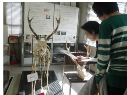
[11月3日は自然史博物館まつり]