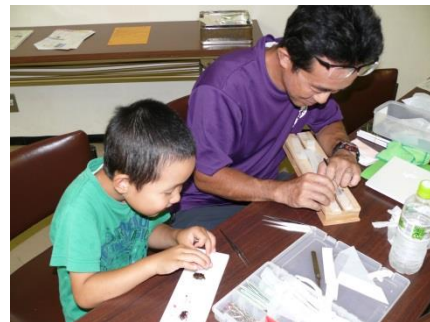
[7月18日 「昆虫の採集と標本作り」]