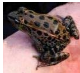
ナゴヤダルマガエル