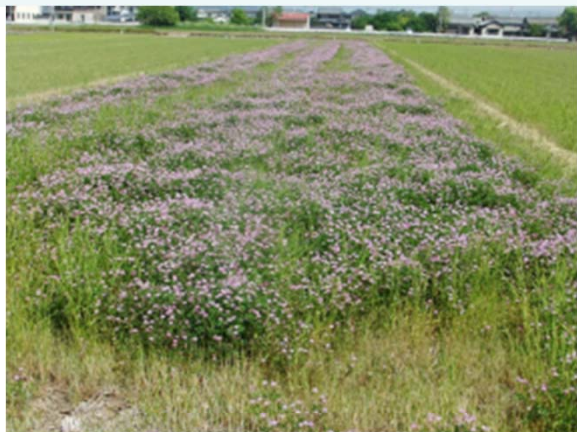
カバークロップ(緑肥)