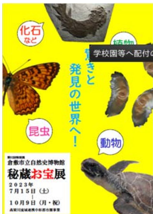
特別展「倉敷市立自然史博物館秘蔵お宝展」

【計画・事業の概要】岡山県内を中心として自然史全般について常設展示で盛り込めていないテーマについて、収蔵資料や外部団体の協力を生かした展示を行う。