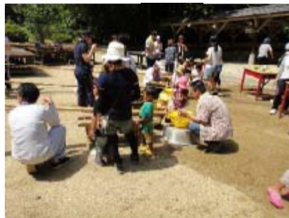
かるがもキャンプ