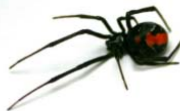
オオクチバス(左) オオキンケイギク(中) セアカゴケグモ(右)