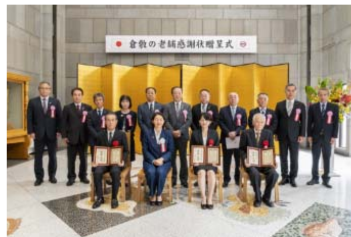
倉敷の老舗 感謝状贈呈式