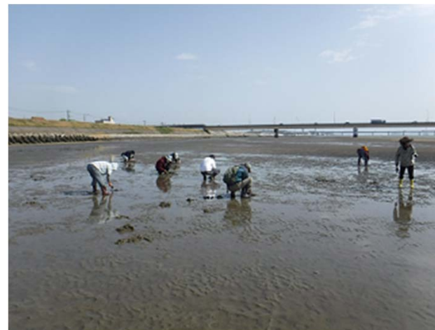
干潟の観察会(高梁川河口)