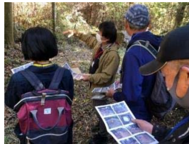
総社市 エコツアー