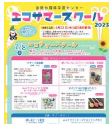
エコサマースクール