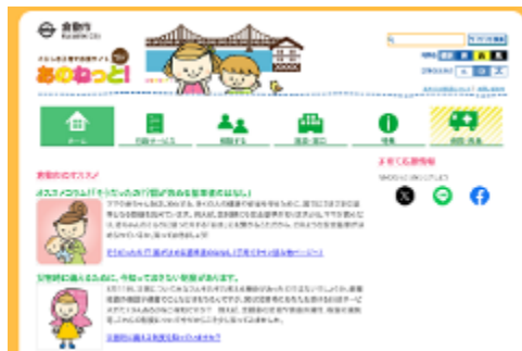
子育てポータルサイト