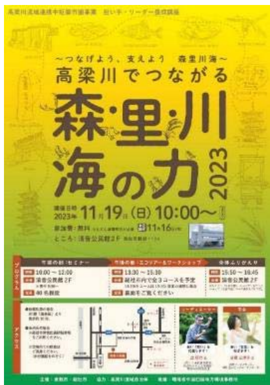
高梁川流域連携中枢都市圏事業

本市の進める生態系ネットワークの取り組みをはじめ、経済的に循環している市内外の優良な企業の取り組みの現場等を巡るツアーの実施及び市民団体等による実施を支援