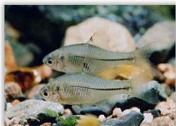
スイゲンゼニタナゴ