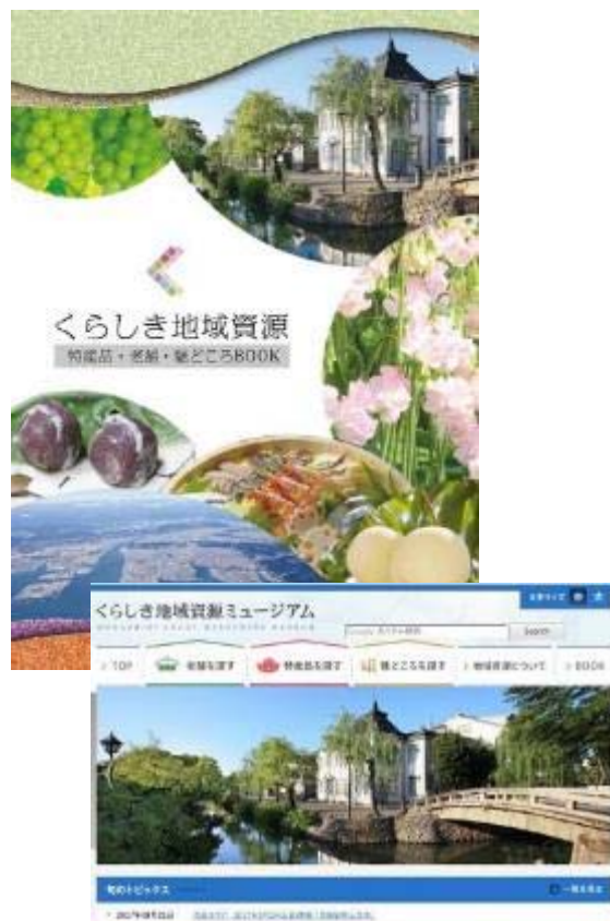
くらしき地域資源BOOK&HP